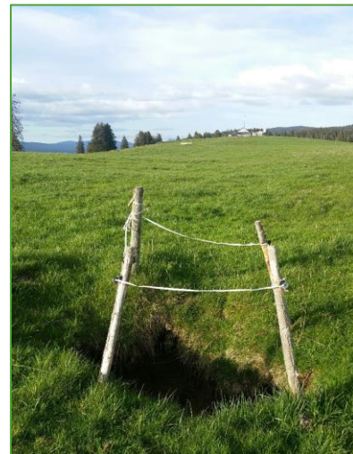
Trou No 1 formé aux Grands Plats, mai 2021