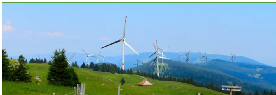
Vue sur les parcs de Grandsonnaz et Provence depuis le Chasseron

En amont des mises à l'enquêtes de Grandsonnaz et Provence, nous entreprenons plusieurs démarches d'envoi de tous-ménages et multiplions les présentations publiques et privées dans les communes porteuses, afin de sensibiliser la population locale. En 2019, un film 2D/3D a été réalisé et prochainement, notre site internet www.volauvent.ch/ sera mis à jour.