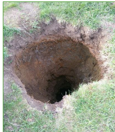
Trou No 2 formé aux Grands Plats, mai 2021 Ø 1m, profondeur 8 m, sur une chambre de ~8m2