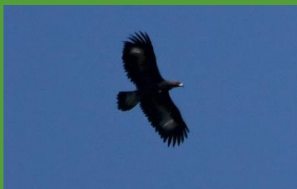
Artémis, l'aiglon né en 2020

Les aigles royaux ont été exterminés à la fin du 18ème siècle. Depuis 2 ans, un couple d'aigles royaux s'est établi sur les hauteurs du Val-de-Travers. En 2020, ils ont donné naissance à un aiglon : Artémis. Surpris par cette nouvelle qui devrait réjouir les amoureux de la nature, les promoteurs se veulent rassurants mais ne rassurent personne : « les aigles ne vont pas voler près des éoliennes et resteront à distance ». Voir l'article RJB .