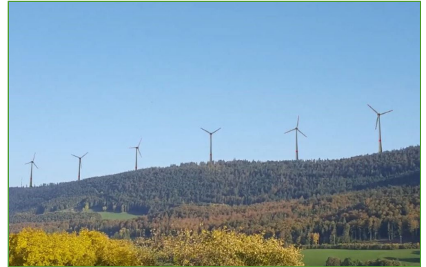
Photomontage extrait du film de Paysage Libre Suisse

Helvetia Nostra, Paysage-Libre Vaud et SOS Jura ont accueilli avec déception et tristesse la décision du Tribunal Fédéral de rejeter leur recours contre le PPA du parc éolien « Sur Grati », au-dessus de Vallorbe. Dans ses considérants, on constate que le TF admet décidément que le développement des parcs éoliens l'emporte sur toute autre intérêt, fût-il également national.