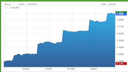
Cours mondial de l'acier 18.08.21 (cliquer)

Les matières premières sont en hausse depuis de nombreux mois. Le prix de l'acier a presque doublé (voir schéma et lien associé). Les conséquences sont graves pour les éoliens, fabricants ou promoteurs. L'équilibre, déjà fragile, de leurs business plans est remis en question. Ecouter cette émission de la RTS à la minute 8'35''