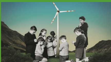
Première illustration de l'article du 10.08.21

Le Temps a encore le courage de publier des caricatures. L'image ci-dessus était donc destinée à illustrer un article de l'Abbé François-Xavier Amherdt intitulé « Pour une spiritualité intégrale : dix appels ». Les réactions ne se sont pas fait attendre et l'image a disparu deux jours après.